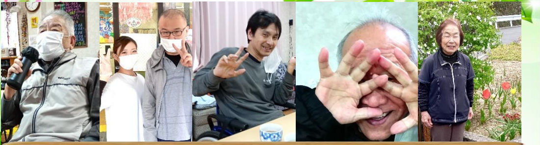
HAPPY BIRTHDAY いろんな人が集まって、仲良く過ごせたらいいなと願っています。

令和6年度の報酬改定は4月と6月の2段階に分かれており、料金変更に関する説明を改めて順次行っていきますので、よろしくお願いたします。